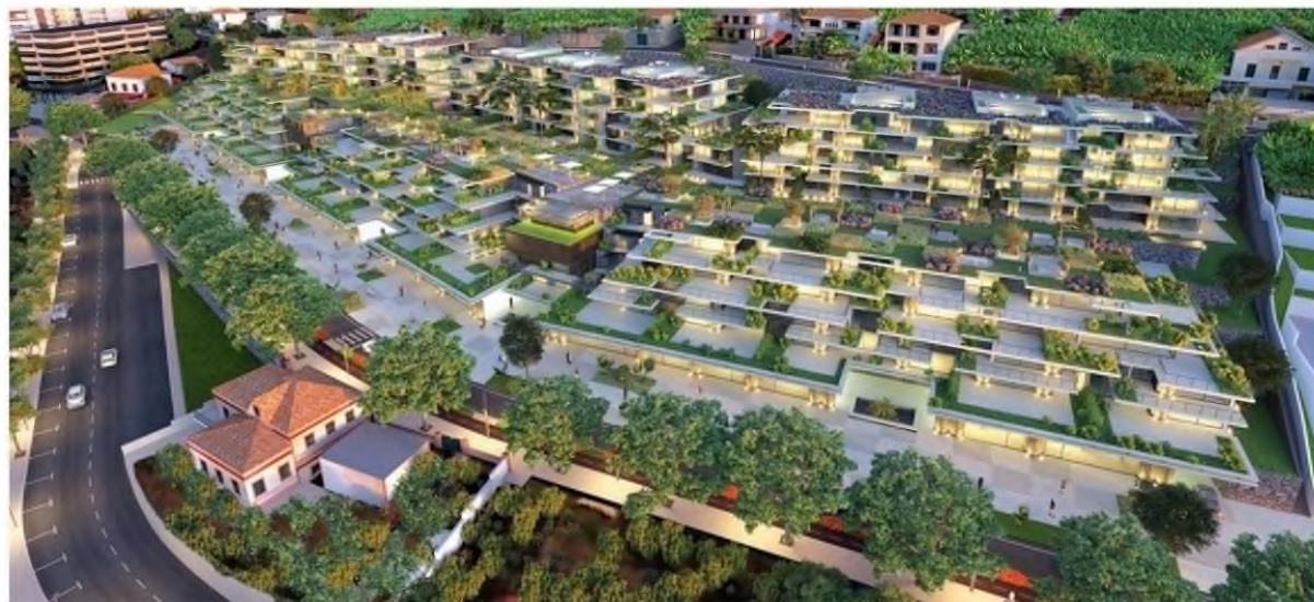
Localização, áreas e materiais são trunfos que o Grupo AFA julga determinantes nos projectos imobiliários.