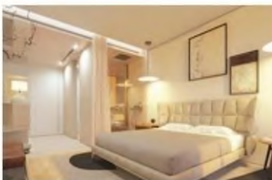
Os apartamentos com características de moradia serão edificados com materiais nobres e de elevada qualidade e durabilidade.